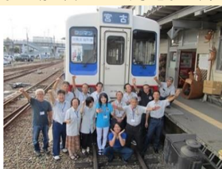
【三陸鉄道】

3日目：大館駅—<田沢湖線>—鷹ノ巣駅—<秋田内陸縦貫鉄道（車窓から秘境の絶景。阿仁合駅で散策）>—角館駅（みちのく小京都を散策）—<東北新幹線>—東京駅着