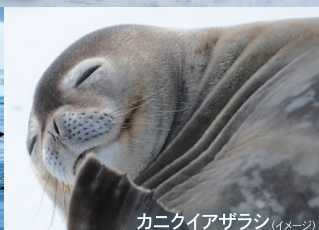
カニクイアザラシ (イメージ)