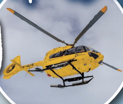
ヘリコプター (イメージ)