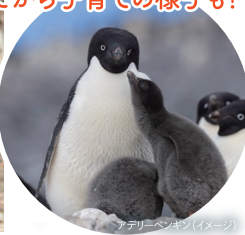
アザラシペンギン (イメージ)