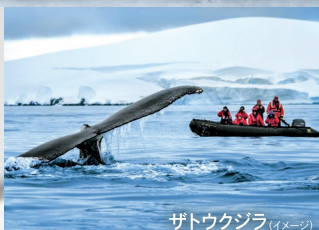
ザトウクジラ (イメージ)