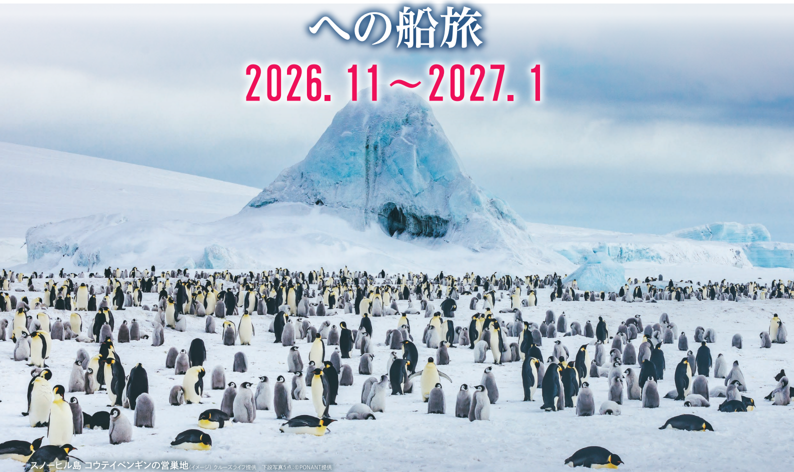
スノーヒル島 コウテイペンギンの営巣地 (イメージ) クルーズライブ提供 下段写真5点: ©PONANT提供