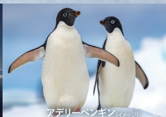
アデリーペンギン (イメージ)