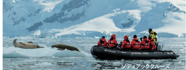
ゾディアッククルーズ (イメージ)