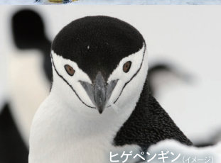
ヒゲペンギン (イメージ)