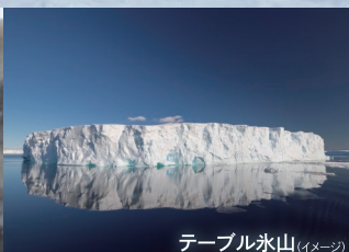
テーブル氷山 (イメージ)