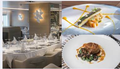
料理(イメージ)