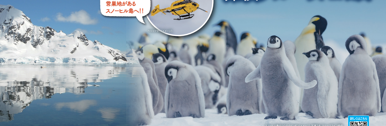
スノーヒル島のコウテイペンギン (イメージ)