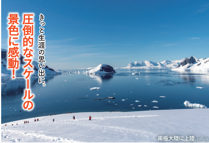
南極大陸に上陸 (イメージ)